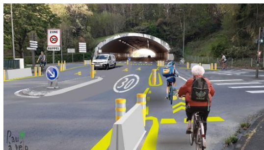
Proposition de l'association : expérimentation d'aménagements destinés à sécuriser les usagers à vélos