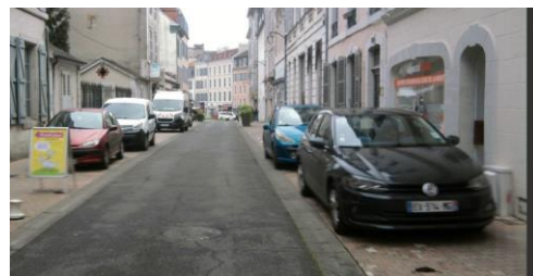
Les trottoirs de la rue Bernadotte encombrés de voitures