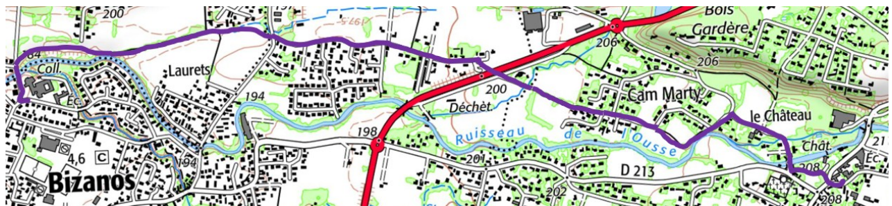
Section ouest de l'itinéraire des « Lavandières à Vélo » proposé par Pau à Vélo et soutenu par la Ville de Bizanos

L'association se réjouit également de la perspective d'une promenade continue le long de l'Ousse, de la gare jusqu'au collège des Lavandières. Plus à l'est, nous portons le projet « Lavandières à vélo » pour que collégiens et habitants de Bizanos Est, Idron et Lée puissent rejoindre le cœur de l'agglomération, et donc le quartier de Rives de Gave, par un itinéraire cyclable et marchable lisible, sécurisé et continu. Ce projet a déjà été présenté à de nombreux acteurs, et notamment aux Villes de Bizanos, Pau et Idron, ainsi qu'au Département.