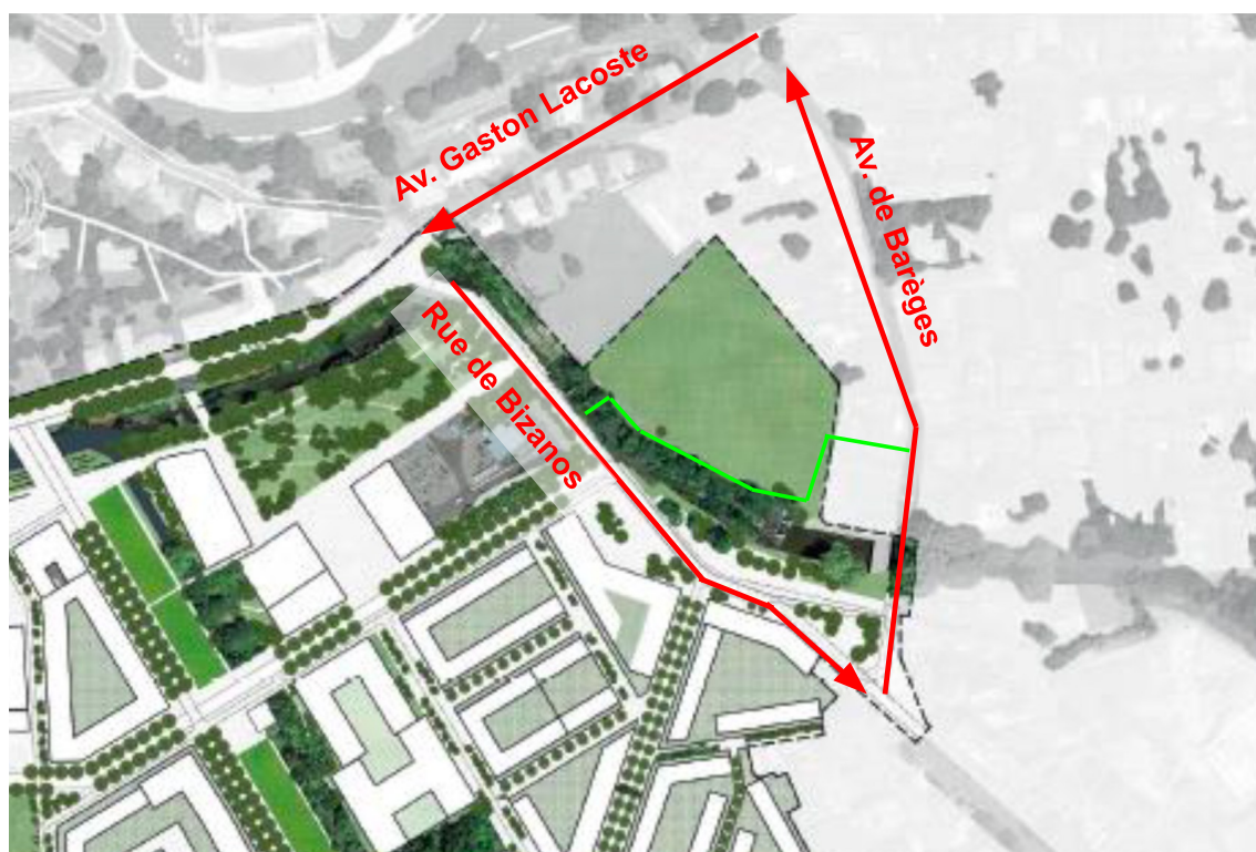
Figure 2 : « triangle » de sens uniques pour ouvrir Rives de Gave au nord et à l'est

Il est important de noter que ce passage en sens unique a déjà été en grande partie expérimenté , pendant près de trois mois lors du Grand Prix 2023. Comme on le voit sur la photo A, l'avenue Gaston Lacoste était alors en sens unique dans le sens est-ouest, afin de permettre le passage des piétons et des cycles malgré les barrières de protection. Cette expérimentation fut couronnée de succès, sans incidence majeure sur la circulation, ni de report indésirable de trafic.