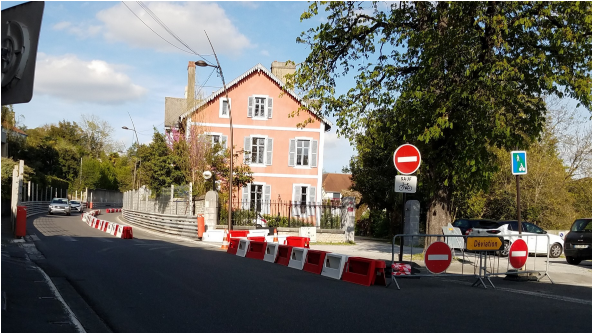
Photo A : expérimentation de l'avenue G. Lacoste en sens unique lors du GP 2023

Plus à l'ouest, au-delà de ce tronçon en sens unique, il est essentiel de retravailler l'avenue Gaston Lacoste jusqu'à la gare . Entériner la fin du Grand Prix est l'occasion de transformer ce qui est aujourd'hui un circuit automobile en un boulevard urbain apaisée et végétalisée. La très large voirie permet de conserver un double sens de circulation motorisé, d'aménager de larges trottoirs et pistes cyclables ainsi que planter des arbres. Le nouveau visage de cet axe invitera aussi à le traverser en provenance ou à destination du centre-ville, ce qui est loin d'être le cas dans sa configuration actuelle.