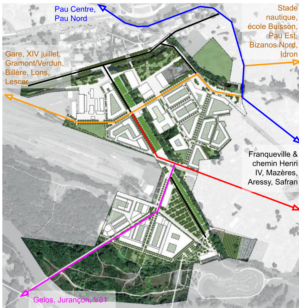
Figure 1 : réseau express vélo au sein de Rives de Gave

« Ceci en privilégiant les sens uniques, avec pour unique optique de desservir les différents logements. Les voies ont été pensées pour que le quartier ne devienne pas un raccourci d'accès à la gare. » (p. 21, notice explicative)